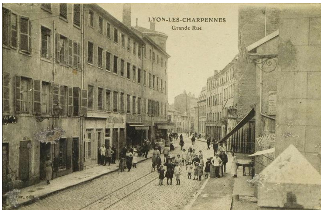
Carte postale de la Grande Rue des Charpennes, actuelle rue Gabriel-Péri, au début du XX e siècle.